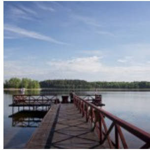
Poilsiautoju ir žvejų patogumui